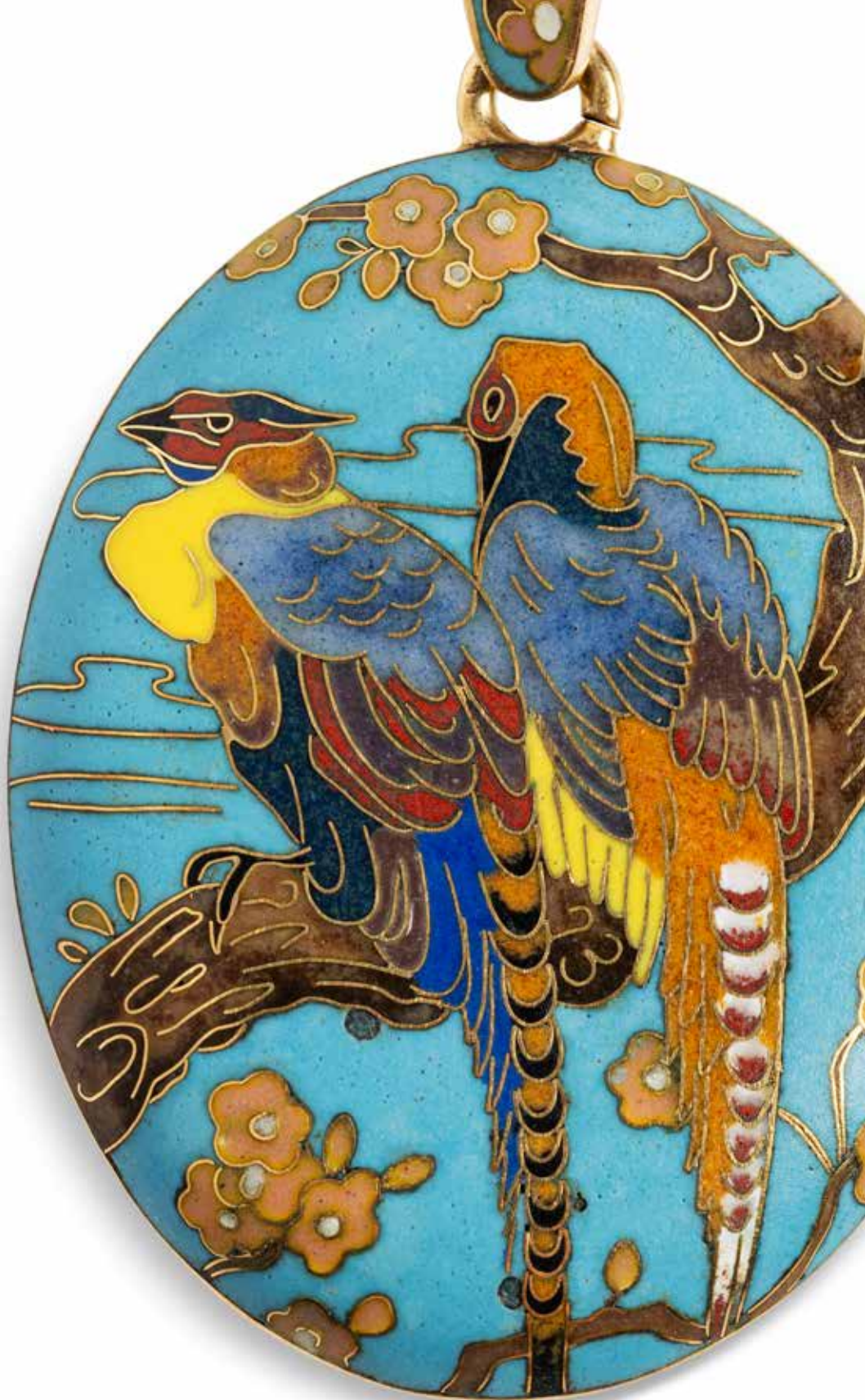
Hiroshige Utagawa (1797-1858), Estampe, Faisan et chrysanthèmes.