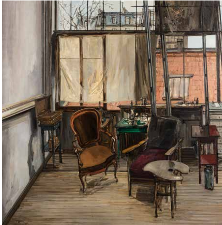
Francis GRUBER, L'Atelier , Huile sur toile, 160 x 160 cm, Signé et daté en bas à gauche F Gruber 1943