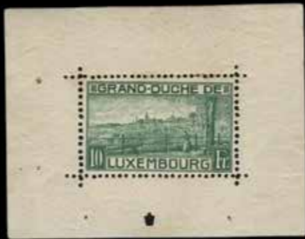
du n° 38