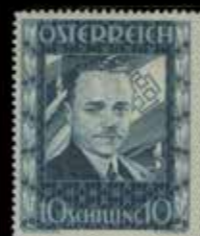
du n° 115