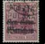
du n° 125