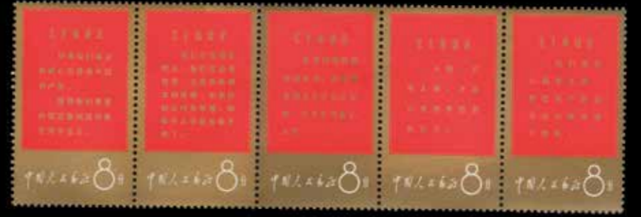
du n° 141