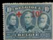
du n° 38