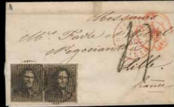
du n° 123