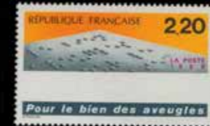
du n° 83