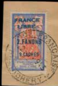
du n° 67