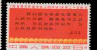
du n° 141