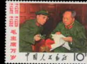
du n° 141