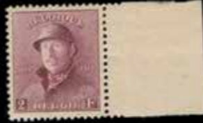
du n° 38