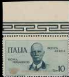
du n° 133