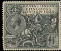
du n° 133