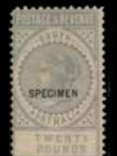
du n° 152