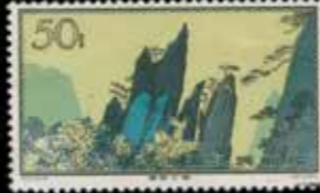
du n° 150