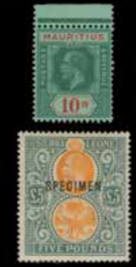
du n° 152