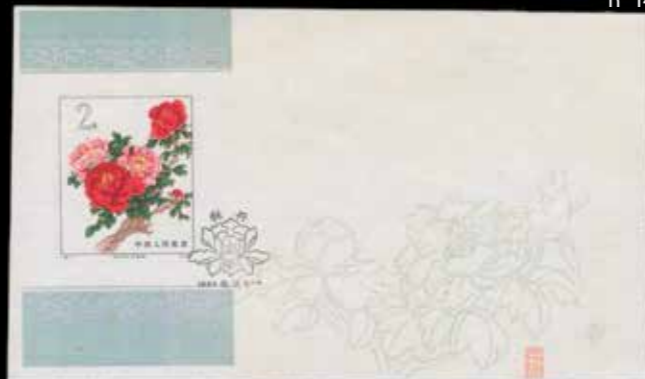
du n° 143