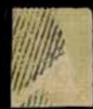
du n° 49