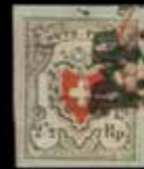
du n° 49