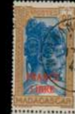
du n° 67