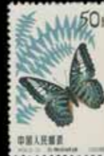
du n° 150