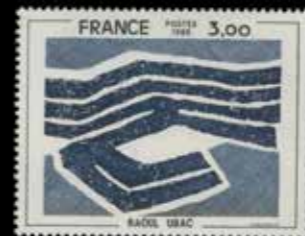
du n° 83