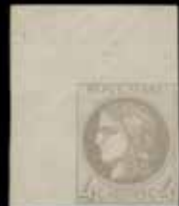
du n° 85