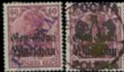
du n° 125