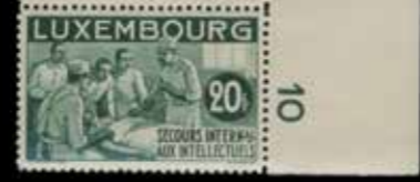
du n° 38