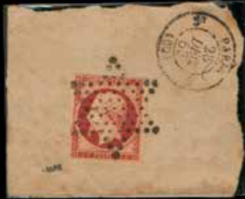
du n° 85