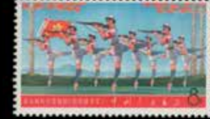
du n° 141