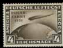
du n° 133