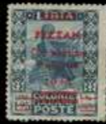
du n° 67