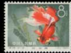
du n° 150