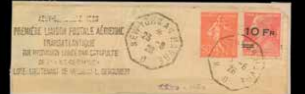
du n° 80