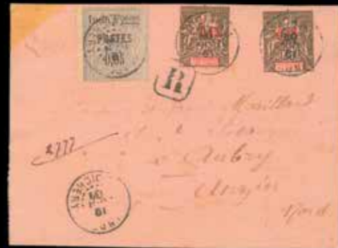
du n° 70