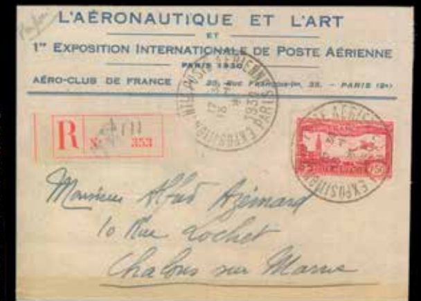
du n° 80