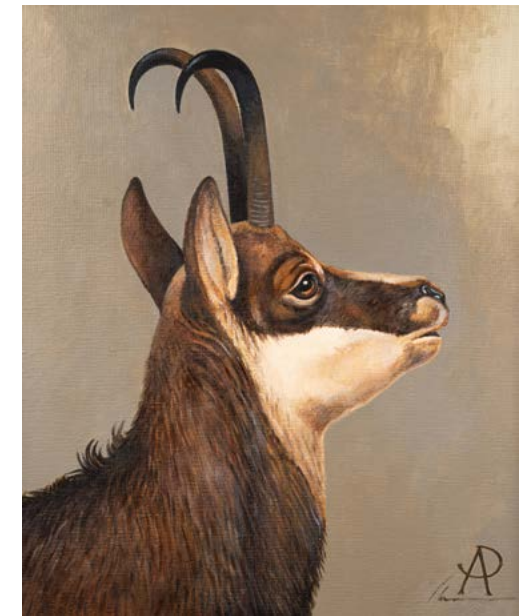
208 - Blaise PRUD'HON (1958 - ?) Tête de chamoix Huile sur toile 65 x 65 cm Signé en bas à droite Contre-signé au dos avec cachet 600/ 800 €