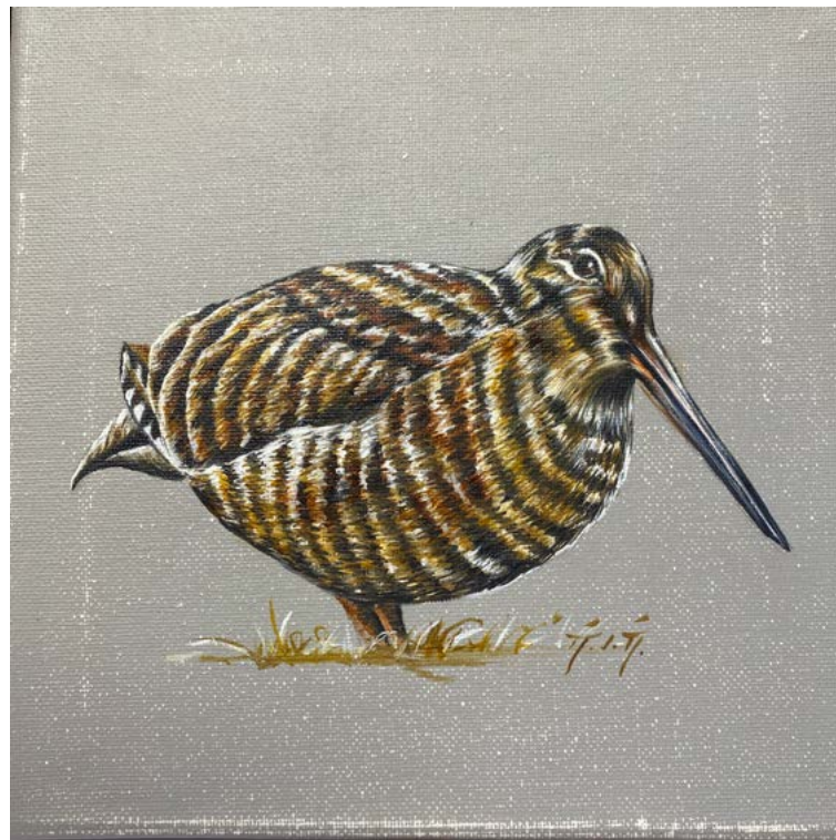
206 - Magalie de Mauroy (XXI) Bécasse Huile sur toile Signé en bas à droite Contre signé au dos au crayon gris 20 x 20 cm 100/ 200 €