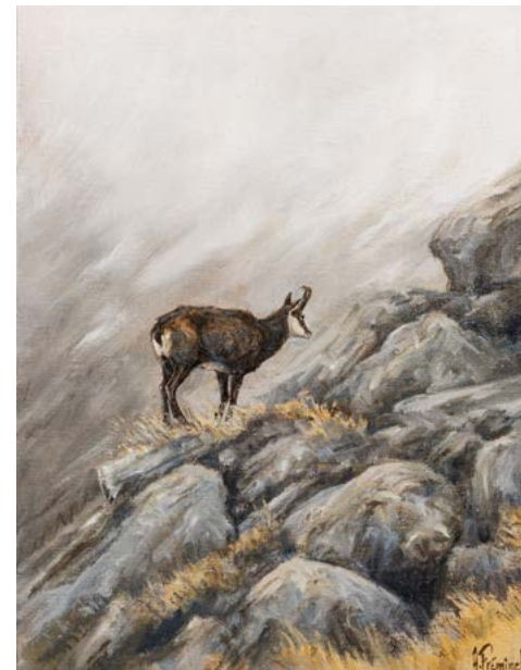
207 - Arnaud FREMINET (1961) Chamois dans la forêt Huile sur toile 35 x 27 cm Signé en bas à droite et contre signé au dos 450/ 550 €