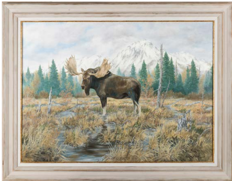
205 - Walter ARLAUD (1974 - ?) Elan Huile sur toile 73 x 100 cm Signé en bas à droite 600/ 800 €