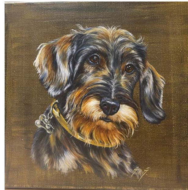
209 - Magalie de Mauroy (XXIème siècle) Teckel sur fond marron Huile sur toile 30 x 30 cm Signé en bas à droite 280/ 320 €