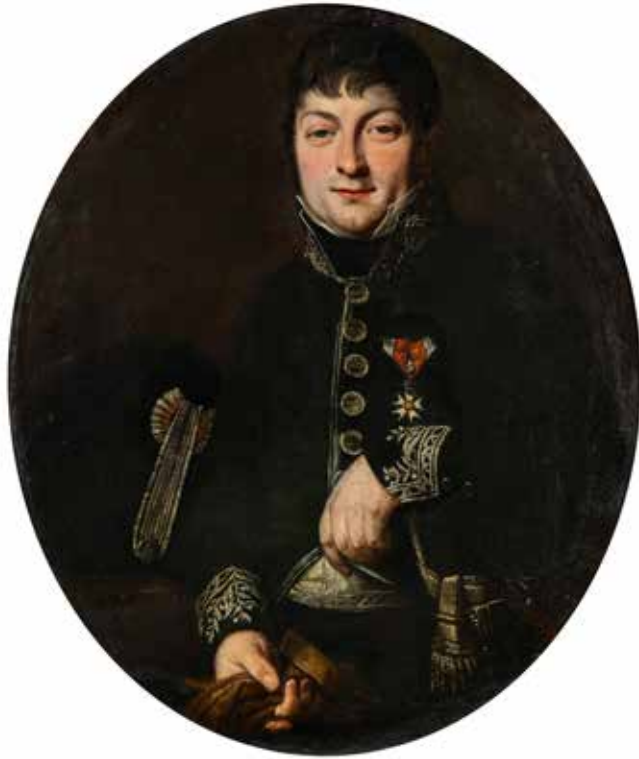
54 - Ecole FRANCAISE vers 1830 Portrait de militaire Toile ovale, probablement découpée dans un rectangle 81 x 68,5 cm