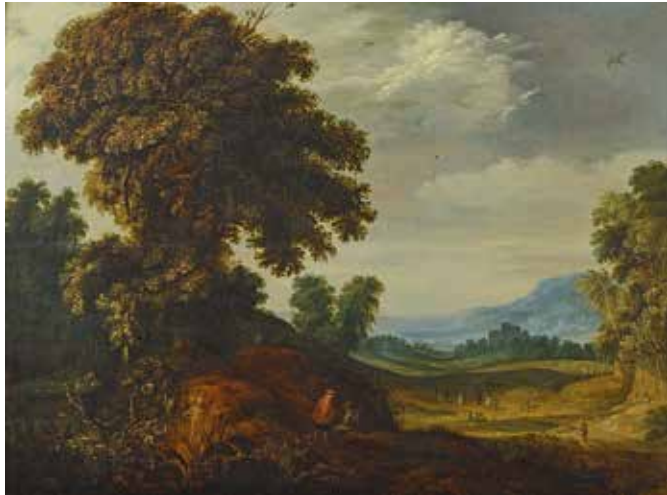
19 - Entourage d'Alexandre KEIRINCX (Anvers 1600 - Amsterdam 1652) Paysage de forêt avec un promeneur demandant son chemin