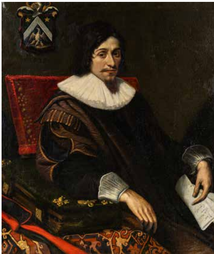
17 - Jean CHALETTE (Troyes 1581 – Toulouse 1643) Portrait de François de Sabateri Sur sa toile d'origine 111 x 98 cm Signé en bas à gauche sur le livre CHALETTE pinxit Restaurations

Un autre portrait de François de Sabateri très similaire au notre se trouve dans une représentation collective des Capitouls de l'année 1627 peint par Jean Chalette (voir C. Cau, Les Capitouls de Toulouse, Toulouse, 1990, p. 118, reproduit).