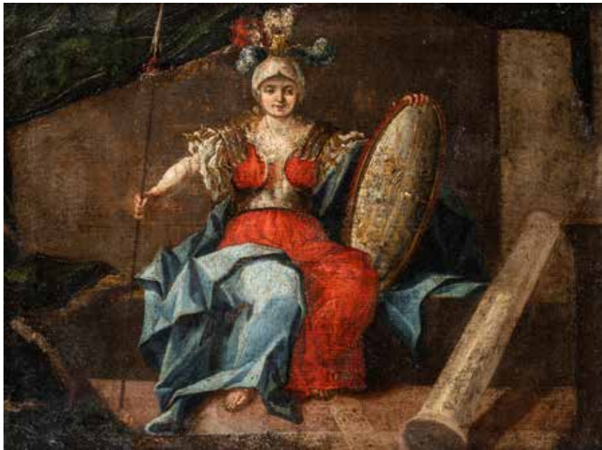
16 - École ITALIENNE du XVIIe siècle Allégorie de la guerre Toile, Possiblement une étude aboutie pour un grand décor. Trace de monogramme en bas à droite Cachet de cire au dos sur la toile. 30 x 44 cm