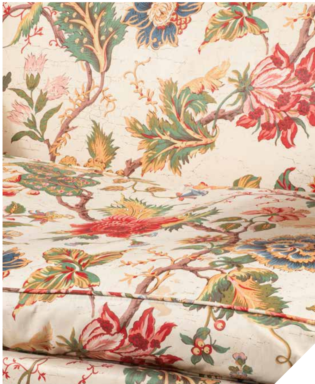
INTÉRIEURS ET CARACTÈRES- Siècles Classiques Vente en préparation / Jeudi 11 mai 2023 lclement@millon.com