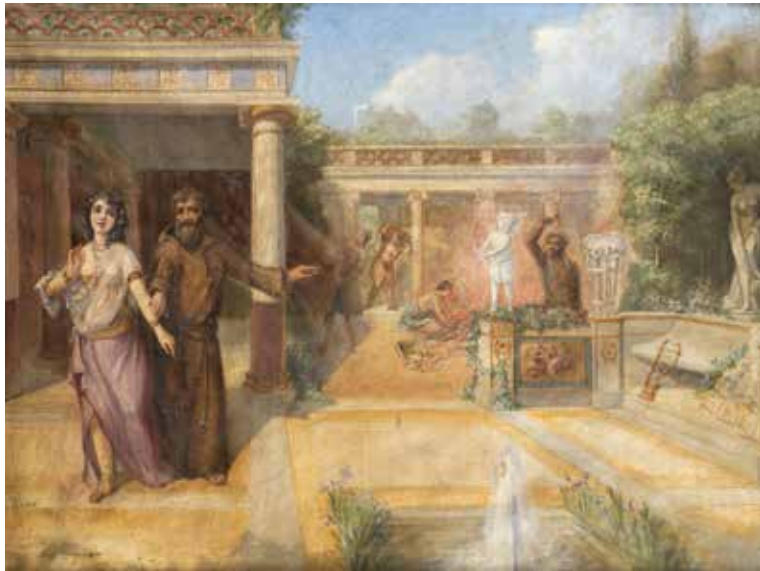
69 - Eugène Charles PICOU ( ? 1831 - ? 1914) Personnages dans un péristyle Toile 65 x 84 cm Signé en bas à gauche C. Picou