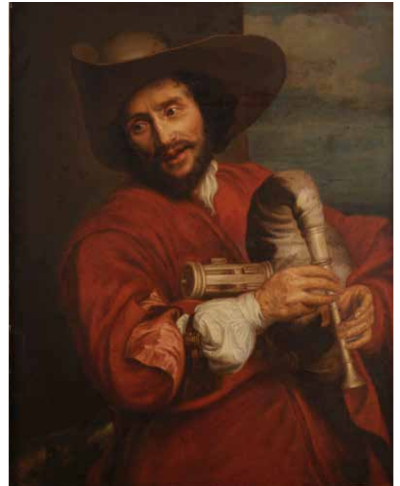
18 - École FLAMANDE du XVIIème siècle, entourage d'Anton Van DYCK Portrait de François Langlois dit de Chartres Toile 90 x 70 cm