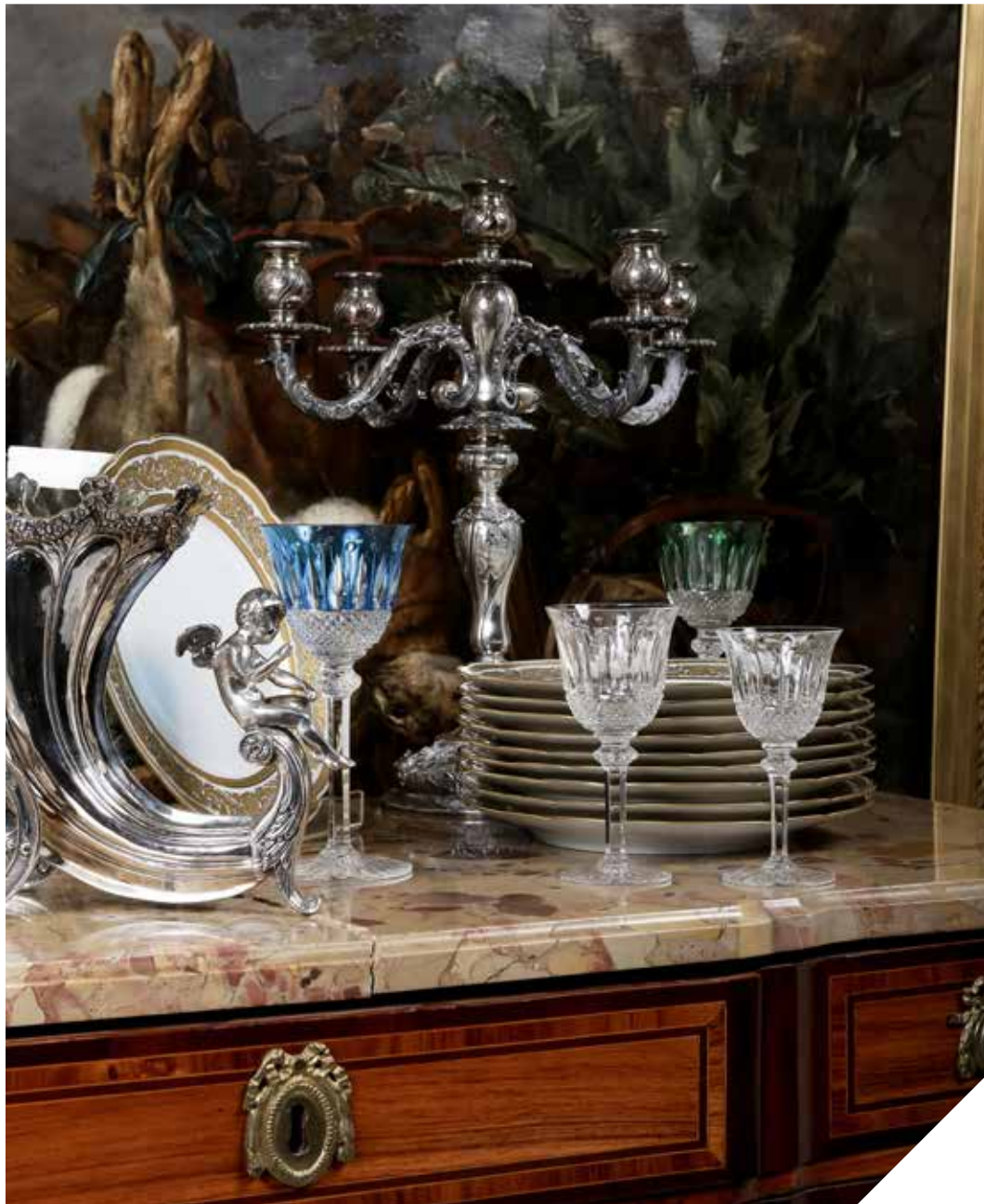
ARTS DE LA TABLE - Siècles Classiques Vente en préparation / Mardi 4 juillet 2023 eculot@millon.com