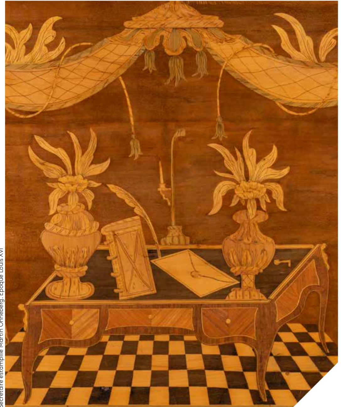
Secrétaire estampillé Martin Ohneberg. Epoque Louis XVI