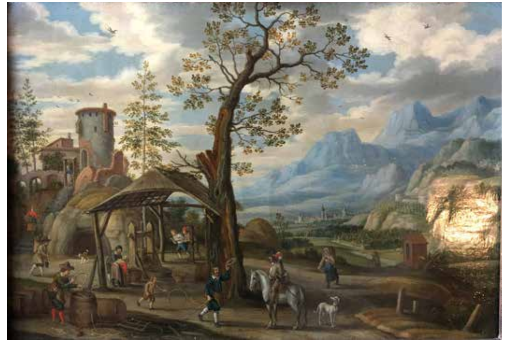
19 - Isaak van OOSTEN (Anvers 1613 – 1661) Les vendanges Cuivre parqueté 33 x 44,5 cm Signé en bas à gauche J. van Oosten Accidents