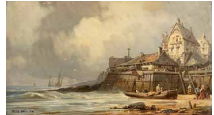
100 - Ecole FRANCAISE de la fin du XIXème siècle, suiveur de Jules NOEL Pêcheurs sur une plage Panneau, une planche 22 x 40,5 cm Porte une signature et une date en bas à gauche JULES NOEL - 1870