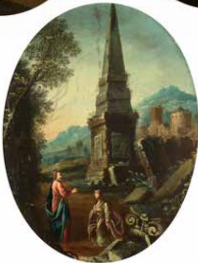
18 - Ecole ITALIENNE du XVIIème siècle Caprices architecturaux et scènes du Nouveau Testament Cinq Panneaux ovales 59,5 x 49,5 cm chaque 3 000/4 000 €