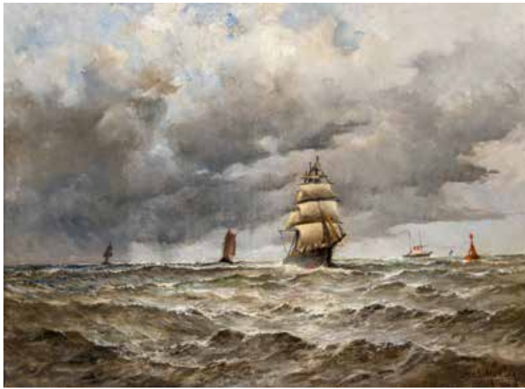
97 - Emile MAILLARD (Amiens 1846 – Le Havre 1926) Bord de mer Toile 545 x 73 cm Signé en bas à droite Emile Maillard