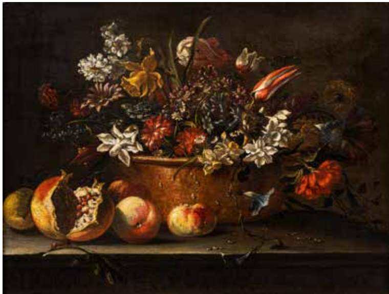
12 - Ecole ITALIENNE du XVIIème siècle Flours coupées dans un bassin de cuivre, grenade et pêches sur un entablement Toile 51 x 66 cm