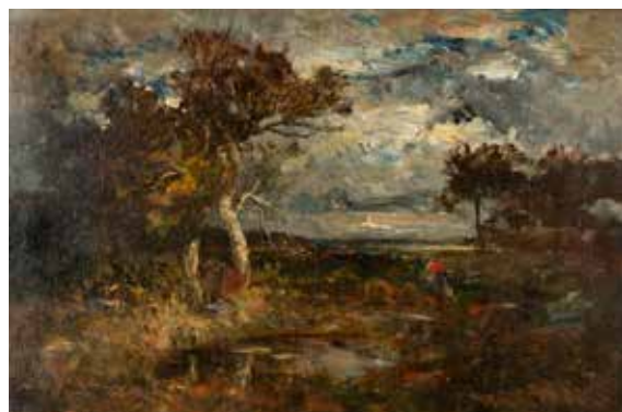
99 - Ecole HONGROISE du XIXème siècle Paysage à la mare Huile sur toile 48 x 72 cm Porte une signature apocryphe en bas à droite L de Paal Beau cadre en bois et stuc doré