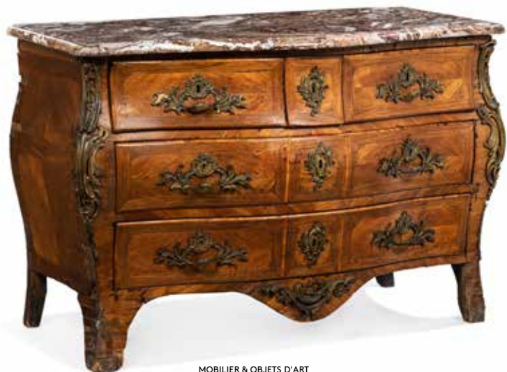
188 - Commode de forme tombeau, la façade et les côtés galbés, à décor marqueté en palissandre dans des filets de bois clair. Elle ouvre par cinq tiroirs disposés sur trois rangées séparées par des traverses apparentes. Montants galbés soulignés de chutes ajourées en bronze doré à décor feuillagé. Ornementation de bronzes ciselés et dorés, poignées de tirage fixes feuillagées, entrées de serrure, sabots. Dessus de marbre Rouge Royal. Epoque Louis XV, estampillée IB Hedouin et poinçon de Jurande H : 87 - L : 128 - P : 63 cm Usures, importants sauts de placage, manques, bronzes à refixer Jean Baptiste Hedouin, reçu maître à Paris le 22 mai 1738