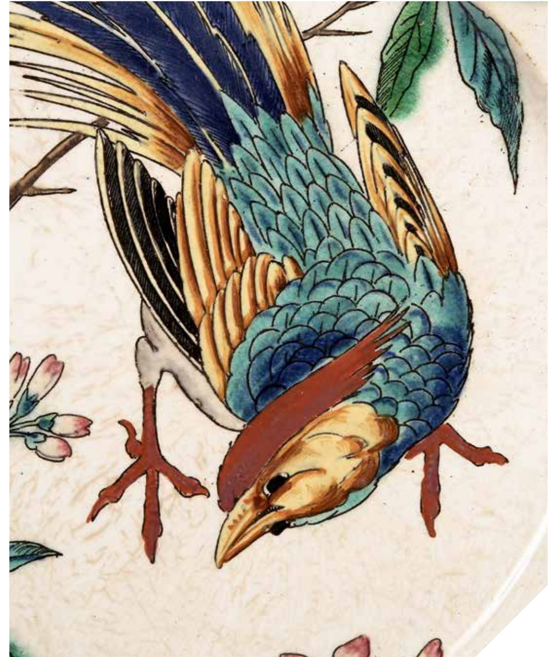
ARTS DE LA TABLE - Siècles Classiques Vente en préparation / Vendredi 21 octobre 2022 eculot@millon.com