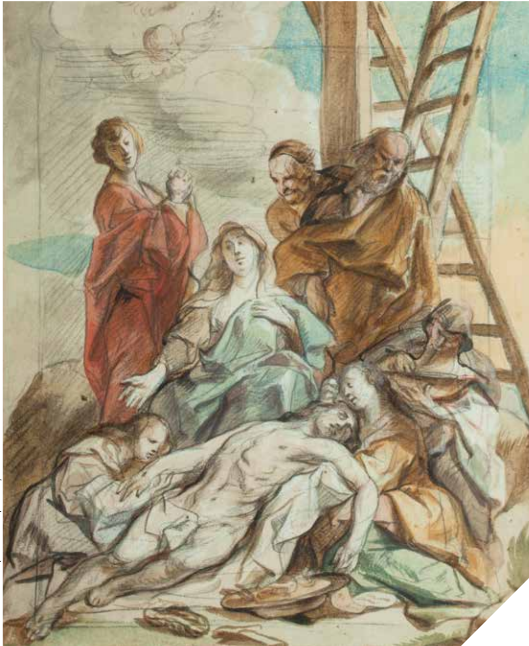
Jacob JORDAENS (1593 - 1678) La Déposition