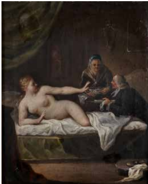
42 - Attribué à Nicolas VLEUGHEL (1668 - 1737) La toilette Toile 28 x 23 cm