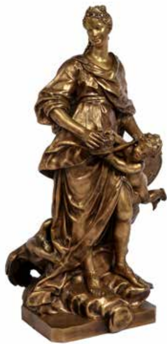
185 - D'après Guillaume COUSTOU (1677-1746) Marie Leszczyńska, reine de France, en Junon Groupe en bronze à patine dorée XIXème siècle H : 70 - L : 37 - P : 24 cm

L'œuvre - avec son pendant représentant Louis XV en Jupiter - est une commande du directeur général des Bâtiments du Roi, le duc d'Antin, en 1725, pour orner le parc de son château de Petit-Bourg. Les deux statues d'une hauteur de deux mètres, intégreront le domaine royal à Versailles après la mort du duc en 1736.