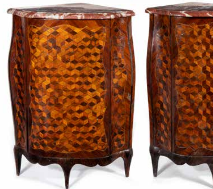
191 - Paire d'encoignures de forme mouvementée, la façade droite, les côtés cintrés et concaves, les montants cambrés à décor marqueté de cubes sans fond en satiné dans des réserves mouvementées sur fond de palissandre et bois de violette. Pieds cambrés. Dessus de marbre Incarnat Turquin. Epoque Louis XV, une estampillée P.H. MEVVESEN et porte les estampilles N Petit et A Lapie H : 88,5 - L : 47 - P : 47 cm Usures, accidents, sauts de placage, manques dont les étagères et certains bronzes, restaurations

Pierre-Harry Mewesen reçu Maître le 26 mars 1766 Des encoignures de forme et de décor similaire sont répertoriées dans la production de Leonard Boudin.