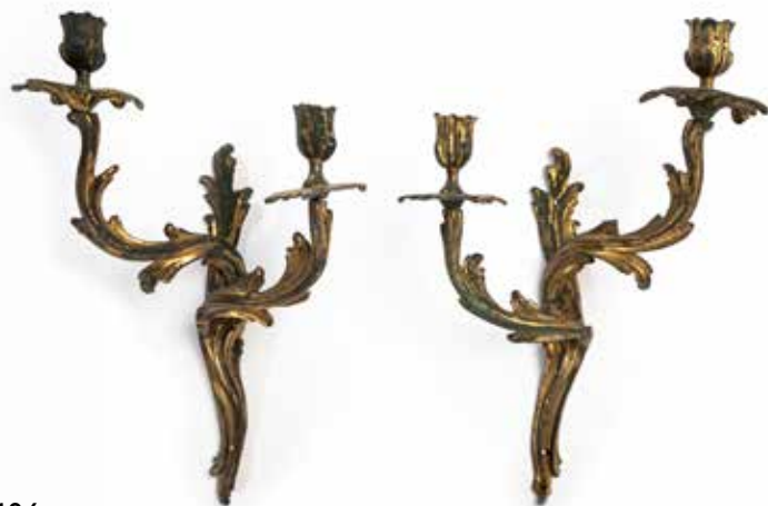
186 - Paire d'appliques en bronze ciselé et doré à deux bras de lumière dissymétriques formés par des enroulements de feuilles d'acanthé Epoque Louis XV H : 41 cm Oxydations