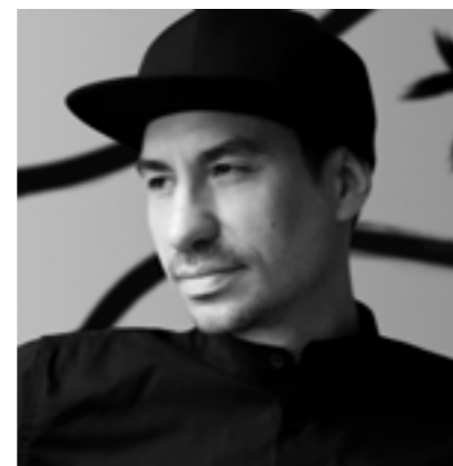
DFT - Differantly