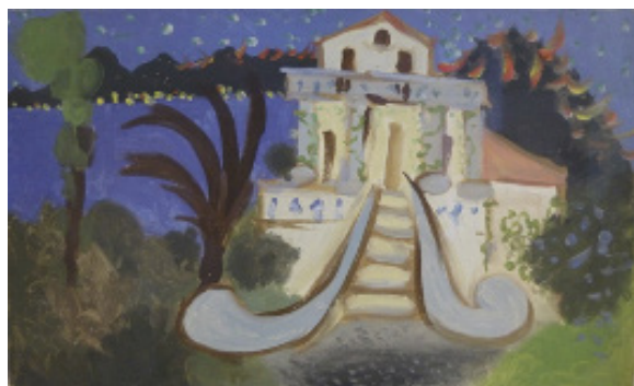
Pablo Picasso, La Villa Chêne-Roc à Juan-les-Pins, 18 août 1931, Musée Picasso, Paris ©Succession Picasso 2022 Crédit photographique : Mathieu Rabeau/Etablissement public de la Réunion des musées nationaux et du Grand Palais des Champs-Élysées

Ce paysage de la Villa Bleue, parmi les plus audacieux tableaux de la même série, nous interpelle de par sa composition avant-gardiste. Henri Matisse ne s'attache pas simplement à nous dépeindre un paysage paradisiaque mais cherche à susciter une émotion, en renversant les codes classiques de la conception de l'espace. Toute l'attention est portée sur les arbres pour mieux suggérer le sujet représenté, la villa. La modernité de la composition est accentuée par le noir du tronc considéré comme une couleur par Henri Matisse qui contraste avec le bleu céleste du ciel, et procure une dimension spirituelle forte. A travers sa recherche d'expressivité qui passe par la lumière, la couleur et la disposition des éléments, Matisse affirme sa volonté de renouveler sans cesse le langage pictural comme son contemporain Pablo Picasso qui quelques années plus tard aura pour inspiration un paysage très similaire, la Villa Chêne Roc à Juan-les-Pins dans laquelle il habitera de 1926 à 1927 avec sa première femme Olga et dont il réalisera plusieurs tableaux en 1931.