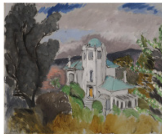
Henri Matisse, Villa bleue, entre mars et juin 1918, 33 x 41 cm, Barnes Collection, Philadelphie