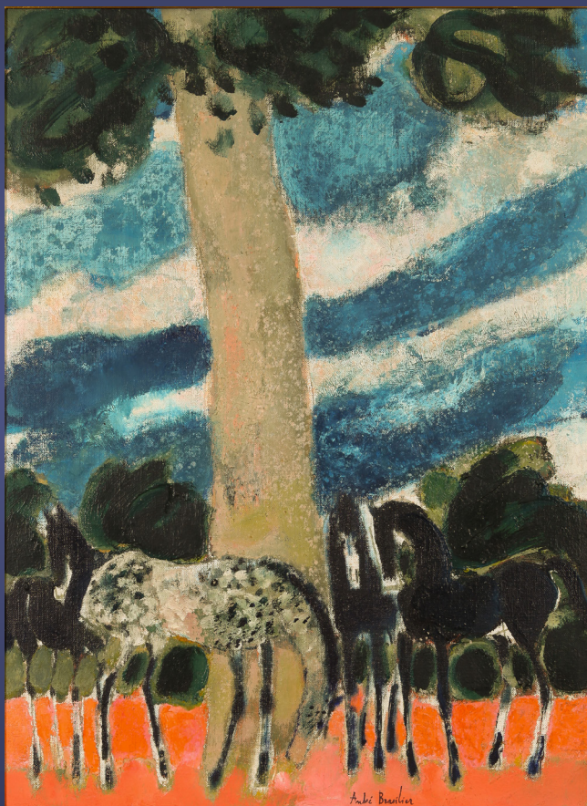
André BRASILIER (Né en 1929) : Chevaux sous un arbre Réalisé en 1963. Huile sur toile. 73 x 54 cm. Signé en bas à droite André Brasilier