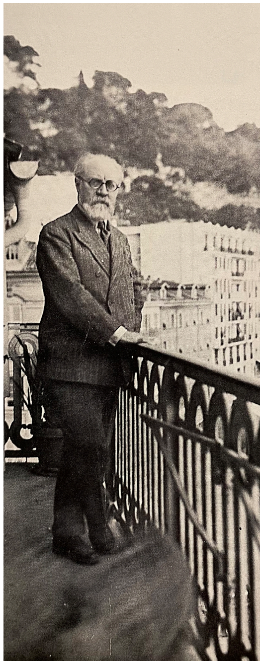
Henri Matisse sur son balcon, 1 place Charles-Félix, début 1930.