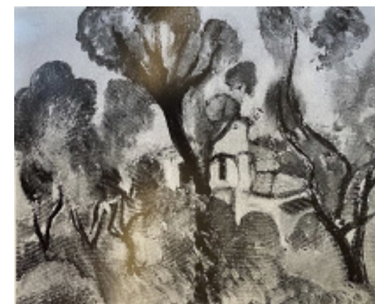
Henri Matisse, La villa bleue, Nice 1918, 33 x 41 cm, Acheté par Bernheim Jeune à Henri Matisse le 26 avril 1918 - Collection particulière

©2022 Succession H. Matisse/Artists Rights Society (ARS), New York