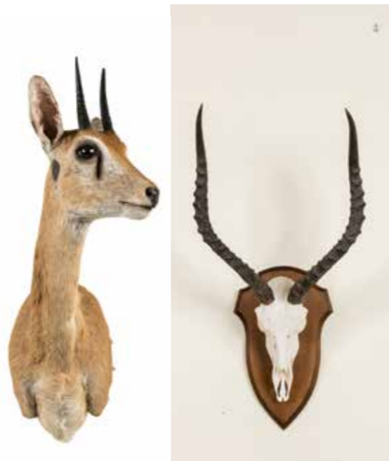
308 - OUREBI, IMPALA Une tête en cape et un massacre. Ourebia ourebi, Aepyceros melampus . CH. 100/200 €