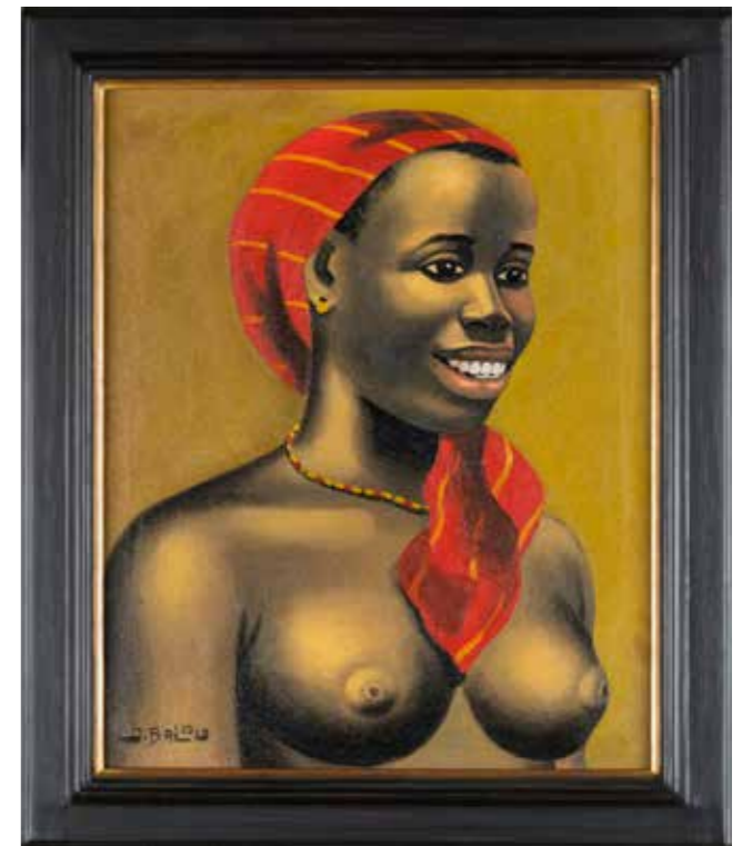
90 - Jean BALOU (1922) Femme africaine au fichu rouge Signé en bas à gauche 50 x 40 cm 100/200 €