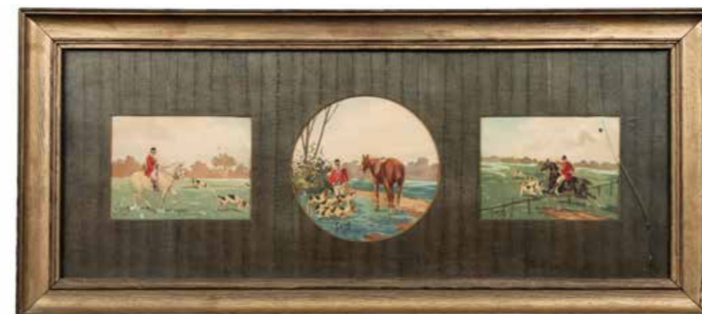
14 - STING (XX) Le veneur et ses chiens Suite de 3 aquarelles sur papier dans un encadrement 21 x 53 cm 50/100 €