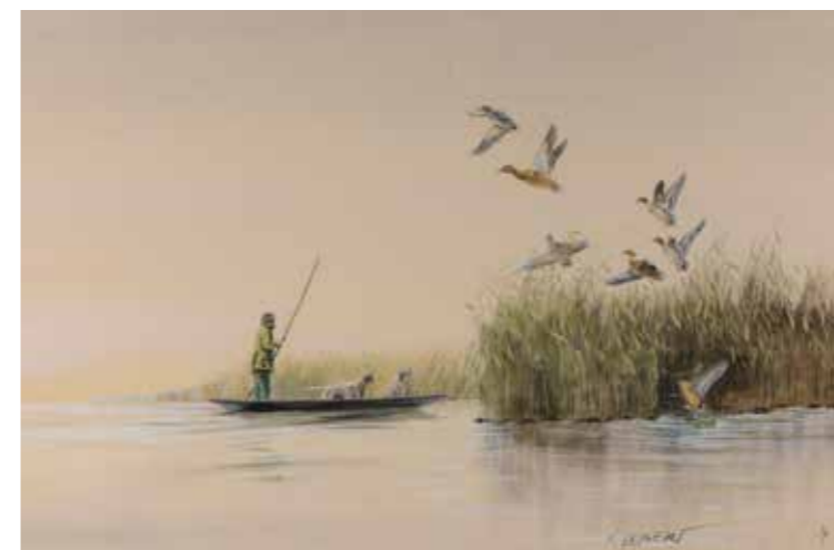
45 - François LEBERT (Xxème) L'envol des canards devant la barque Aquarelle 38 x 61 cm Signée en bas à droite