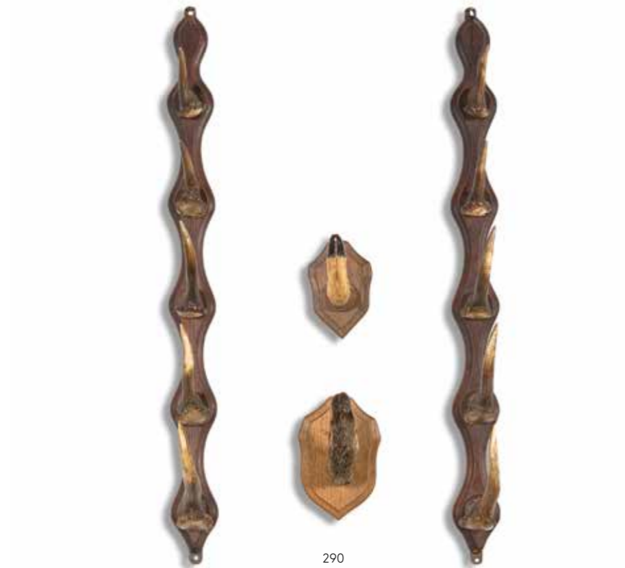
288 - Chevreuril d'Europe Deux grands massacres montés sur des écussons en bois. Capreolus capreolus CH.