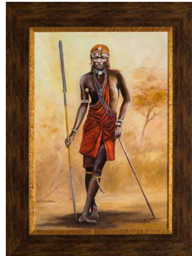
89 - Anne-Marie STEEN (1948) deux guerriers homme et femme africains Deux huiles sur toiles Signé en bas à droite l'un : 73 x 50 cm l'autre : 55 x 46 cm 600/800 €