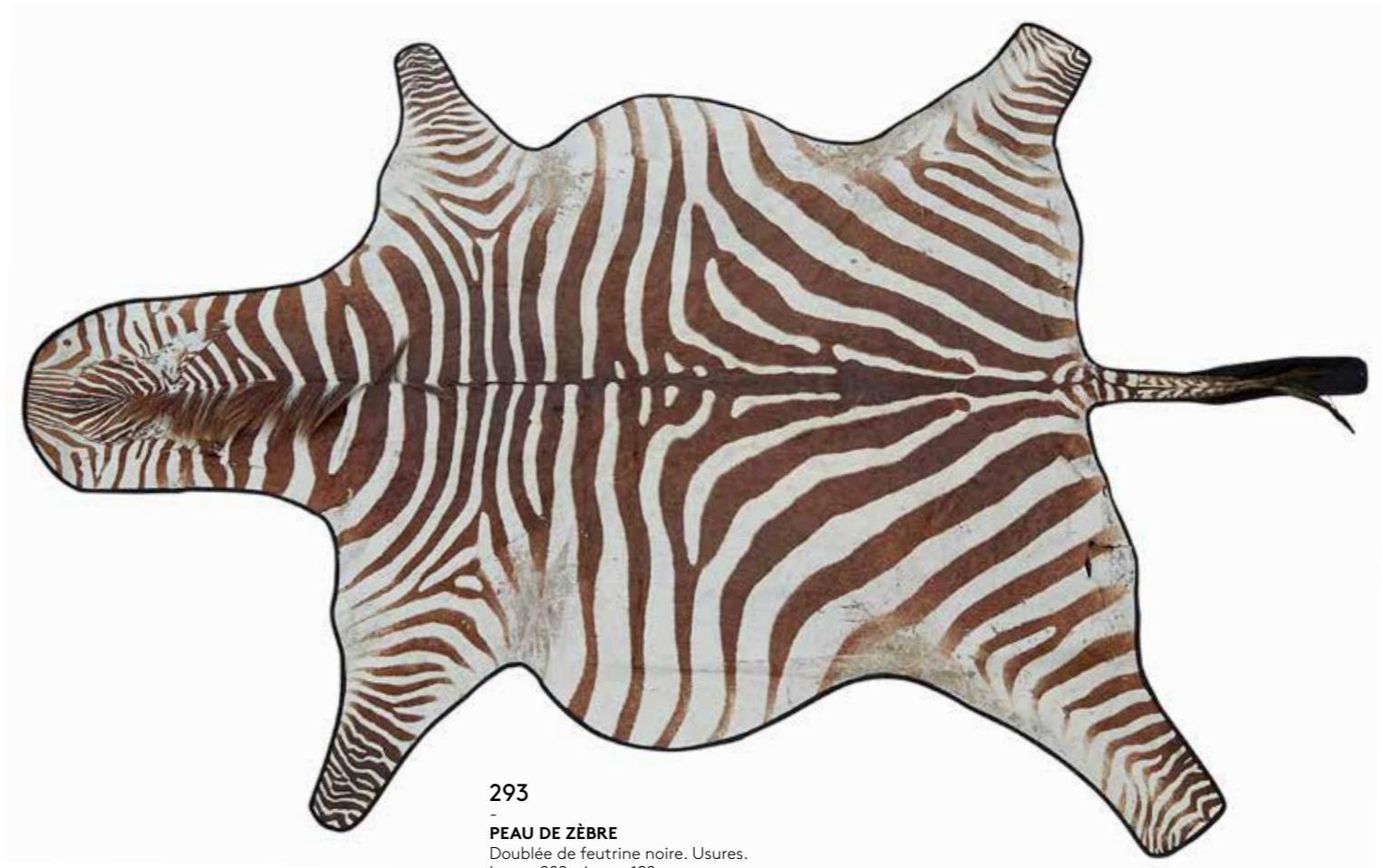
293 - PEAU DE ZÈBRE Doublée de feutrine noire. Usures. Long : 282 x Larg : 192 cm. Equus quagga burchelli .