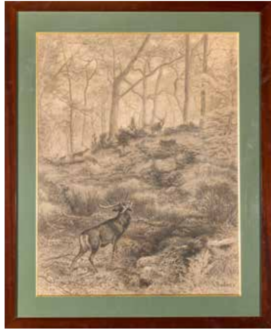
67 - Karl BODMER (1809-1893) Cerfs au brame 65 x 50 cm 100/150 €