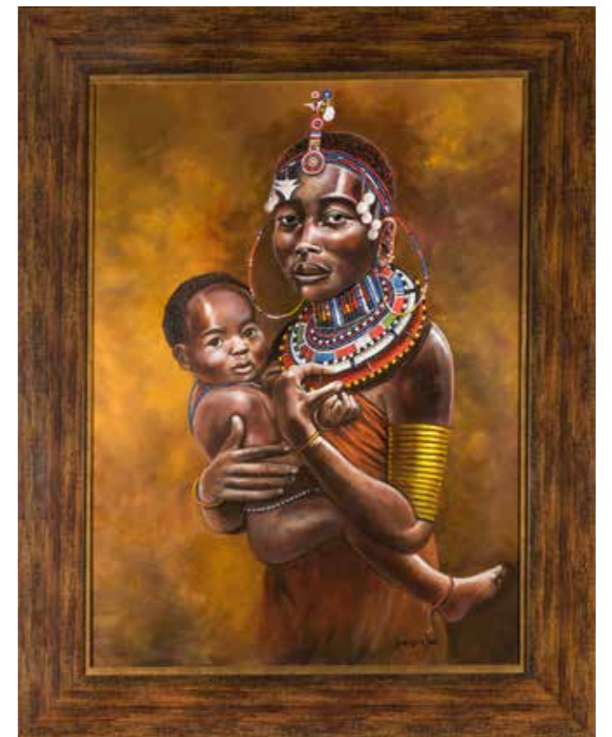
91 - Anna-Marie STEAN (1948) Femme et enfant Huile sur toile Signé en bas à droite 82 x 60 cm. 150/250 €