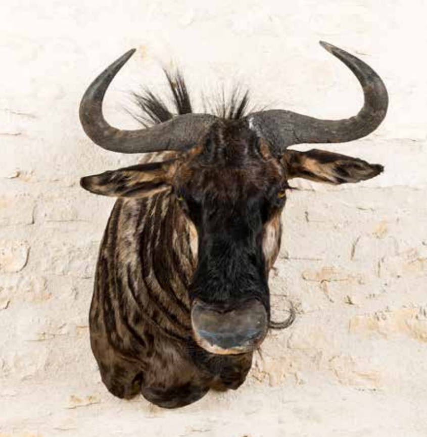
307 - GNOU BLEU Tête en cape. Connochaetes taurinus . CH. 300/400 €