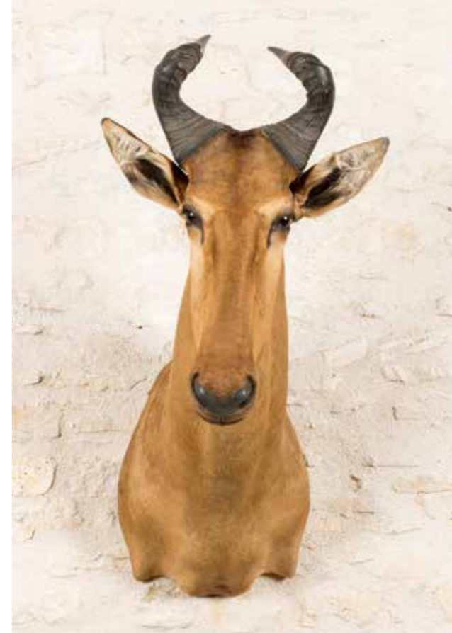
301 - BUBALE ROUX Tête en cape. alcelaphus buselaphus CH. 300/400 €