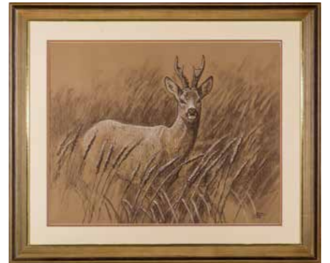
71 - Ecole Française du XXe siècle Brocard Dessin et crayon blanc Signé en bas à droite SZUN MINOCH? 40 x 49 cm.