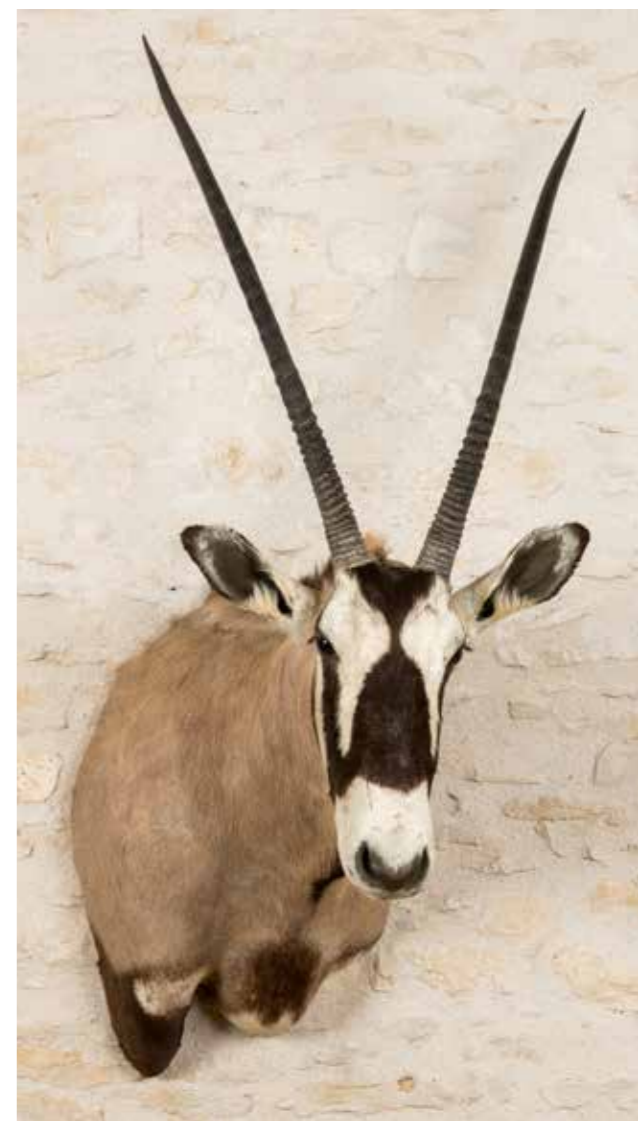
302 - ORYX Tête en cape. Oryx gazella. CH. 500/700 €