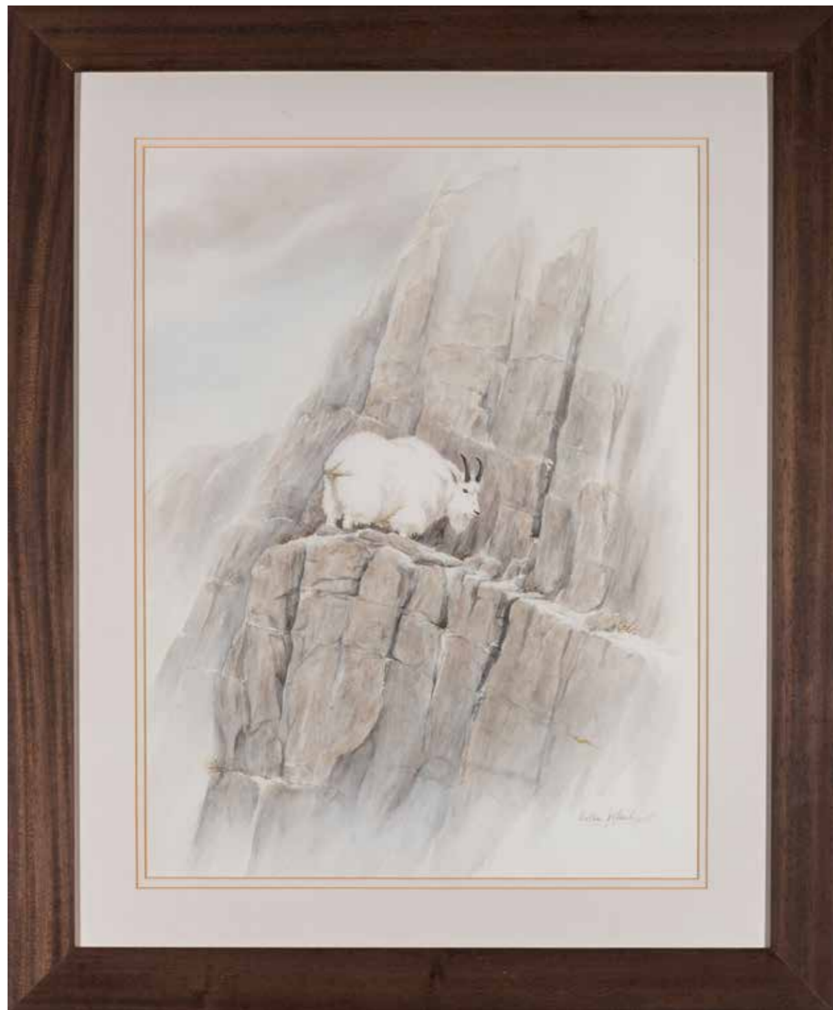
73 - Walter ARLAUD (1974) Chèvre blanche des Rocheuses Aquarelle Signé en bas à droite 52 x 39 cm 400/600 €