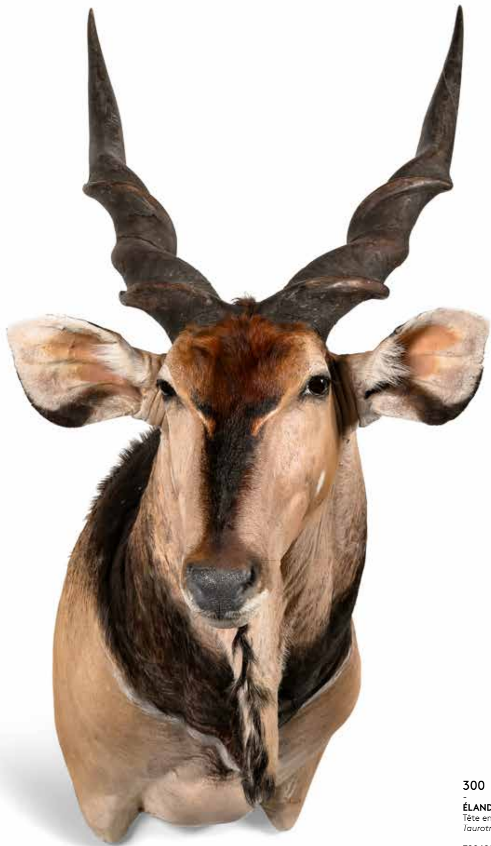
300 - ÉLAND DE DERBY Tête en cape. Très beau. Taurotragus derbianus. 700/900 €