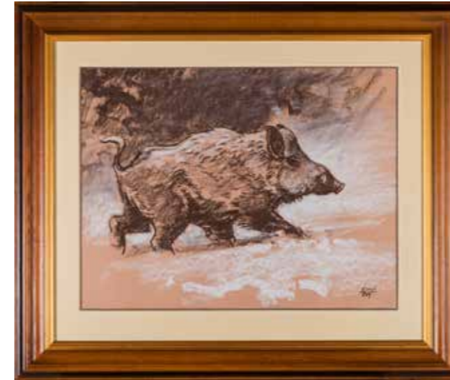
70 - Ecole Française du XXe siècle Sanglier Dessin et réhaut de blanc Signé en bas à droite SZUN MINOCH? 38 x 50 cm