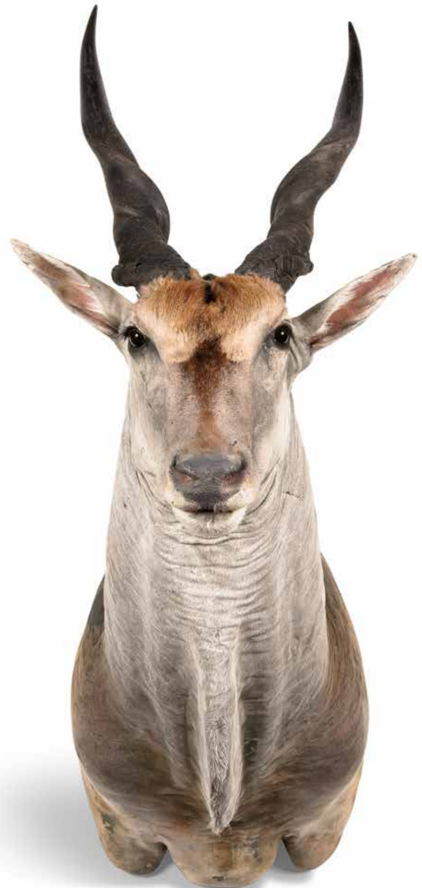
310 - ÉLAN DU CAP Tête en cape. Taurotragus oryx . 400/600 €