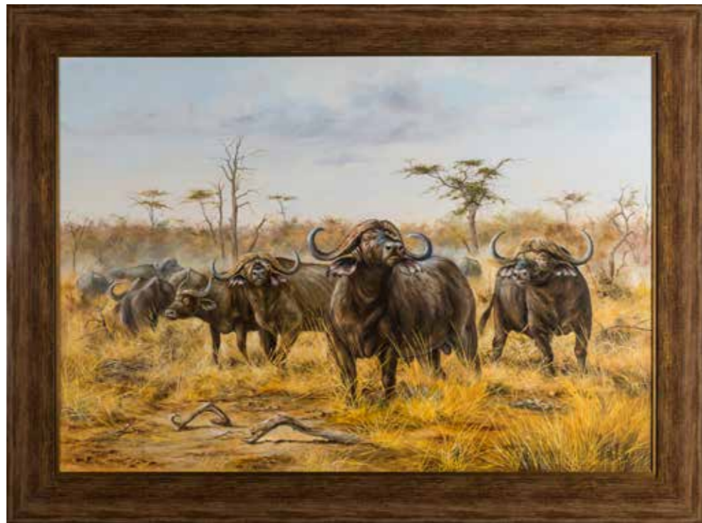
92 - Pierre COUZY (1942) Troupeau de buffles dans la savane Huile sur toile Signé en bas à droite 81 x 116 cm