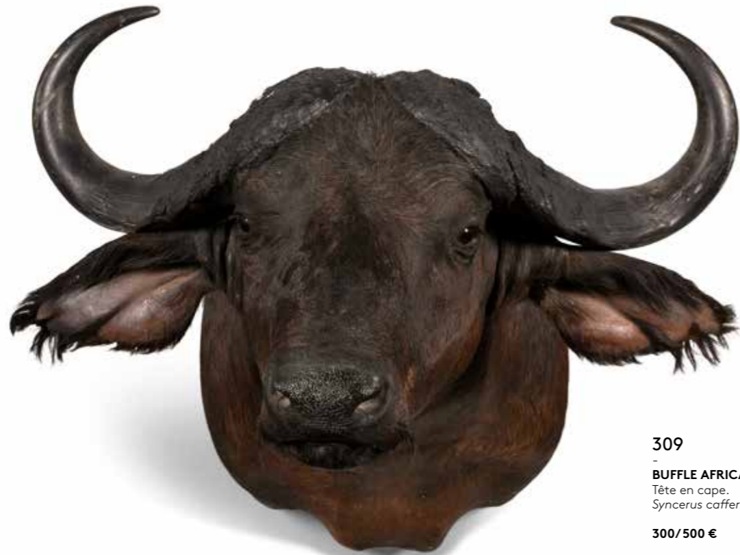
309 - BUFFLE AFRICAIN Tête en cape. Syncerus caffer . 300/500 €