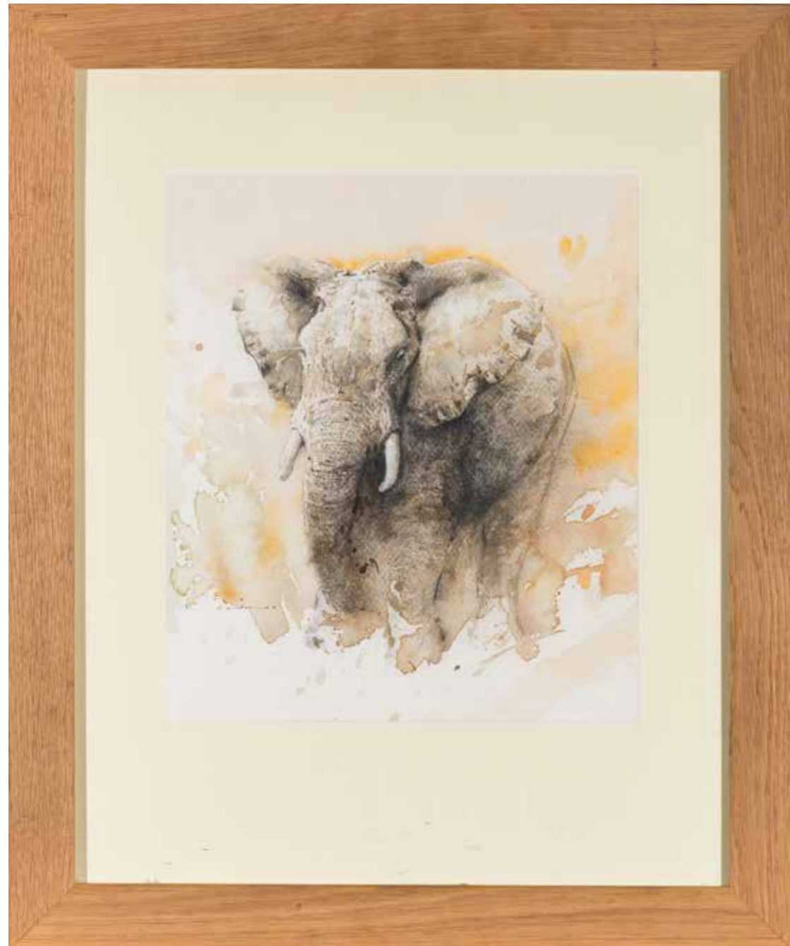
88 - David LEUNG (XX) Elephant Aquarelle Signé au dos et daté 15/08/2009 32 x 28 cm 200/300 €