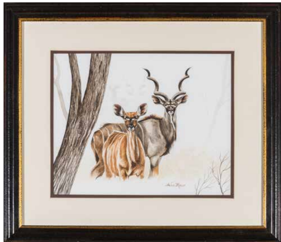
105 - Bernard VERCRUYCE (1949) Etude de Springboks Crayon et pastel Signé au centre et dédié au dos 53 x 33 cm